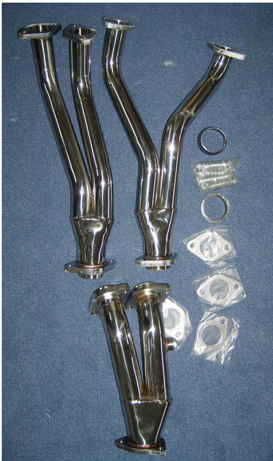
Auspuffkrümmer, Typ EVOFÄG216V