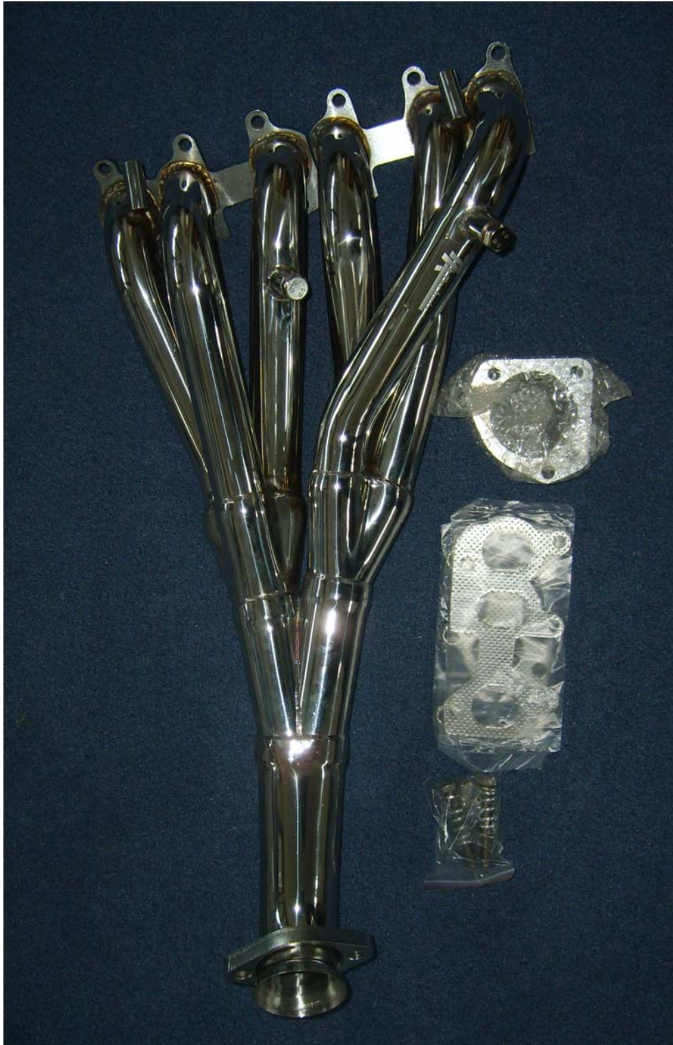
Auspuffkrümmer, Typ EVOFÄVR6